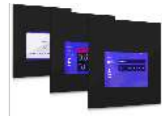
HERMES Control Software Software de control