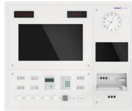
Q-PANEL Control and Display Corian® Panel Panel de control y visualización de Corian®