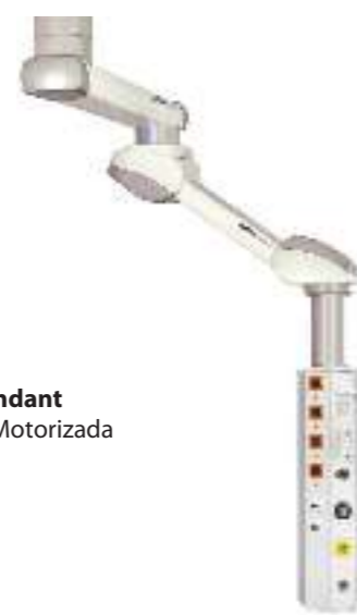
MOTOR COLUMN Motorized Ceiling Pendant Columna Suspendida Motorizada