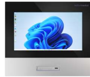
DIAMOND Control and Display Glass Panel Panel de control y visualización de cristal