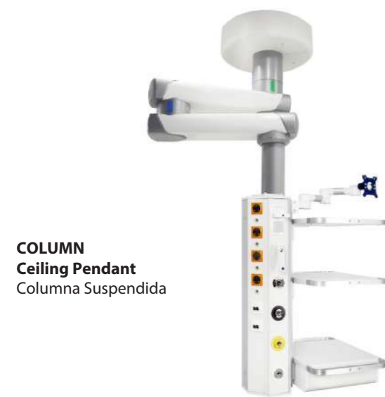
COLUMN Ceiling Pendant Columna Suspendida